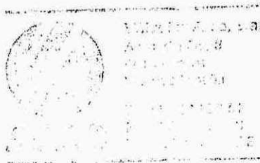
Valvulas Arco S.L.